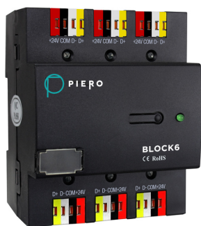
Figura 1. Módulo - BLOCK6