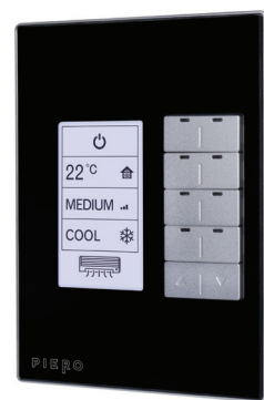
Figura 1. Keypad - KP-LCD10