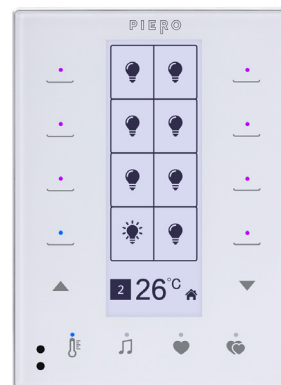
Figura 1. Keypad - KP-LCD14