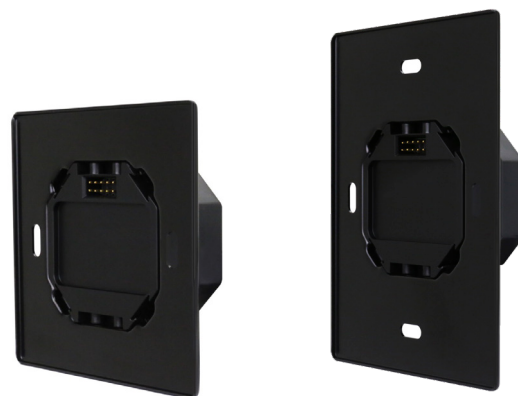
Figura 1. KP-POWER & KP-POWER-EU