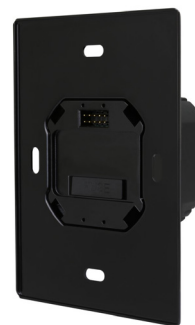
Figura 1. W-KP-POWER-DIM3